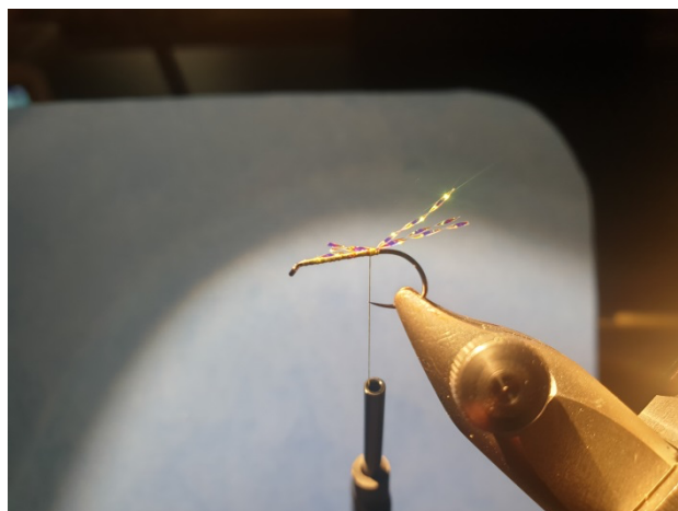
3 kleine Stücke Cristal Mirror Flash einbinden.